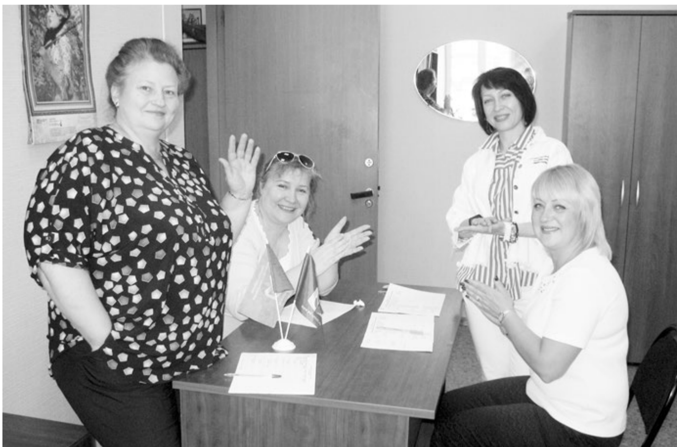
Взыскательное жюри уровнем подготовки конкурсантов довольно